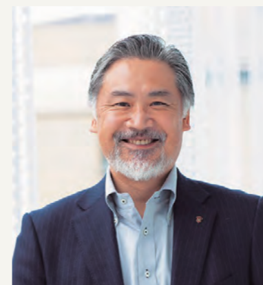
学校法人 滝川学園 大学・短大 学校法人 名栄学院 専門学校